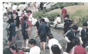
S56 当時は東中ジャージを使う