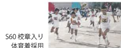
S60 校章入り体育着採用