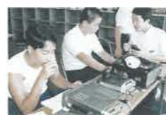
H1 文化祭でアマチュア無線交信