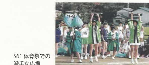
S61 体育祭での派手な応援