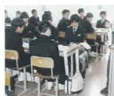
S59 男子は肩掛けカバン、女子は学生カバン