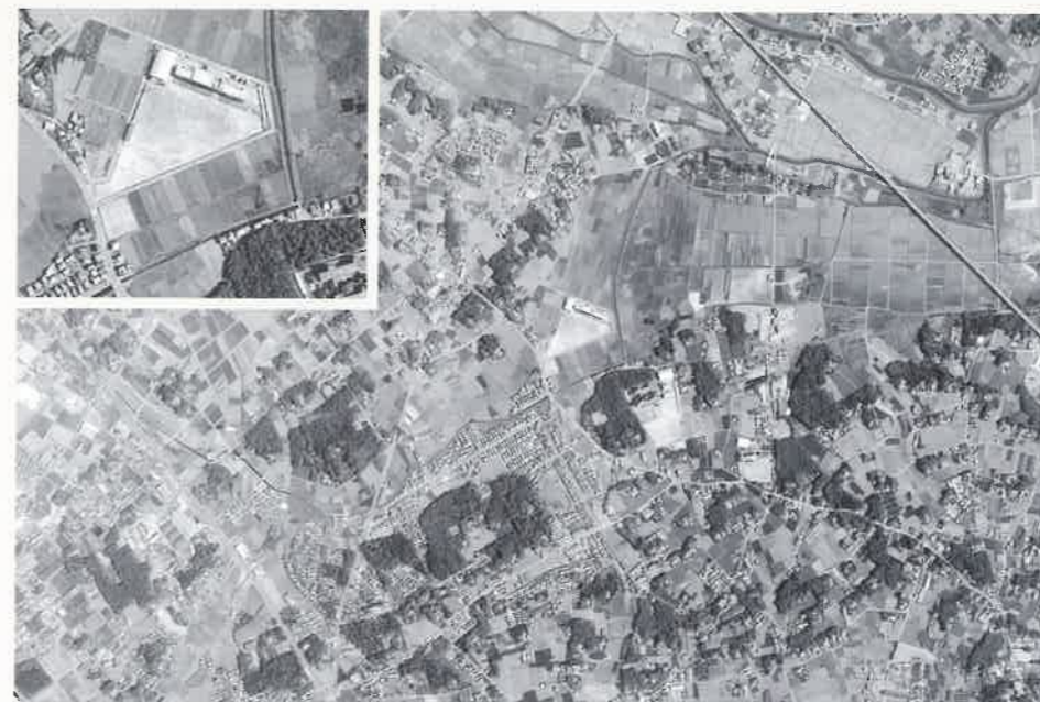
1985年（S60）国土地理院空中写真（枠内は学校付近の拡大写真）

開校5年目の中学校周辺の航空写真。上越新幹線が開業し、学校周辺も徐々に住宅が増えてきたが、学校の周りはまだ田畑。工業団地もまだ整備されていない。