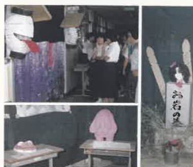
S60 文化祭でのお化け屋敷