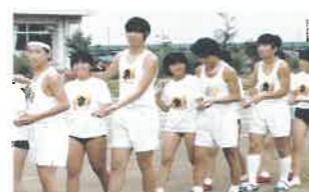
S58 体育祭のフォークダンス