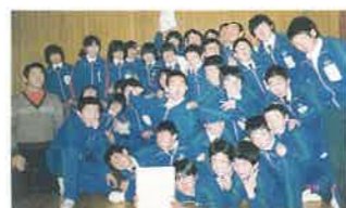
S57 初代ジャージ完成