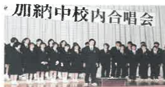
H8 当時は校内合唱会