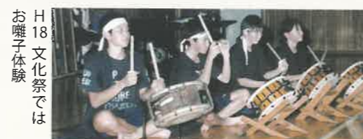
H18 文化祭ではお囃子体験

平成11年度より体験型へと変わりました。また、趣向を凝らした発表も行われています。