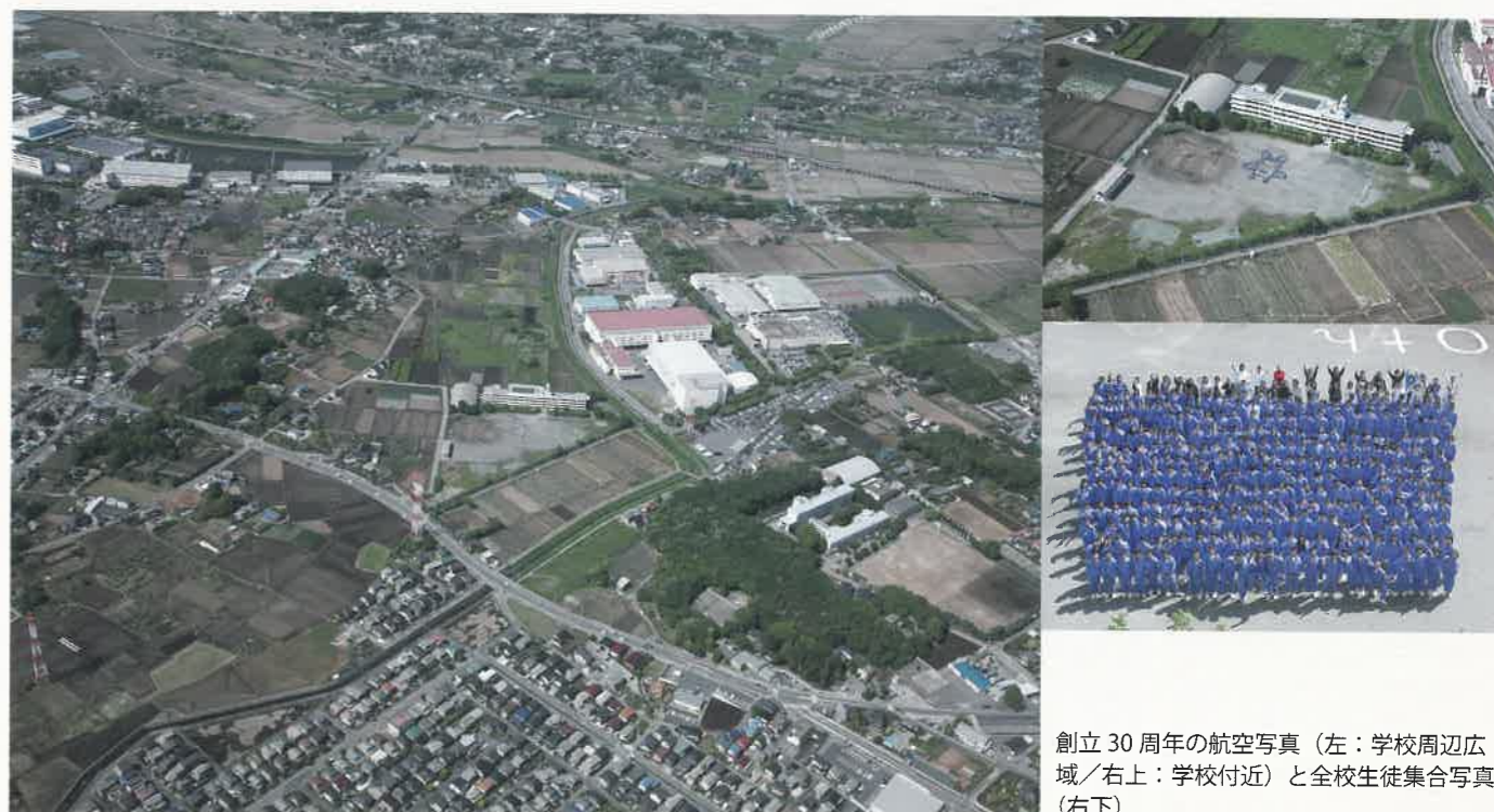
創立30周年の航空写真（左：学校周辺広域／右上：学校付近）と全校生徒集合写真（右下）