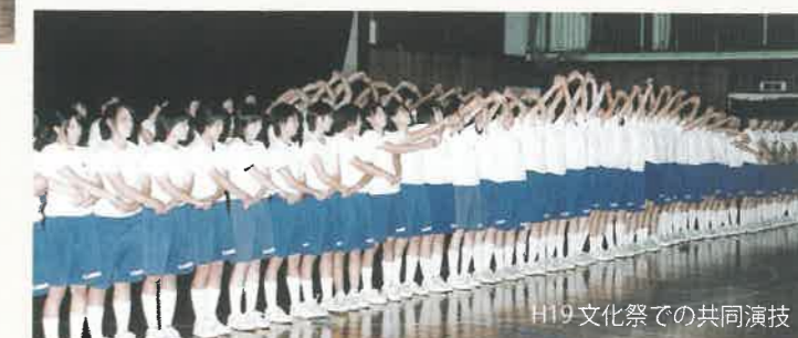
H19 文化祭での共同演技