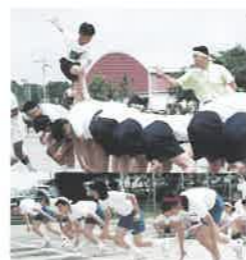
H9 男女ハーフパンツ採用