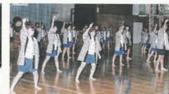
H13 文化祭の定番だったよさこいソーラン