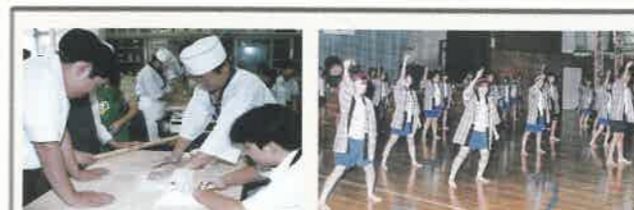
H11 体験型の文化祭に変化