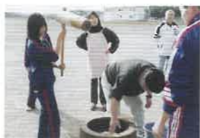
H14 校外学習では餅つき体験