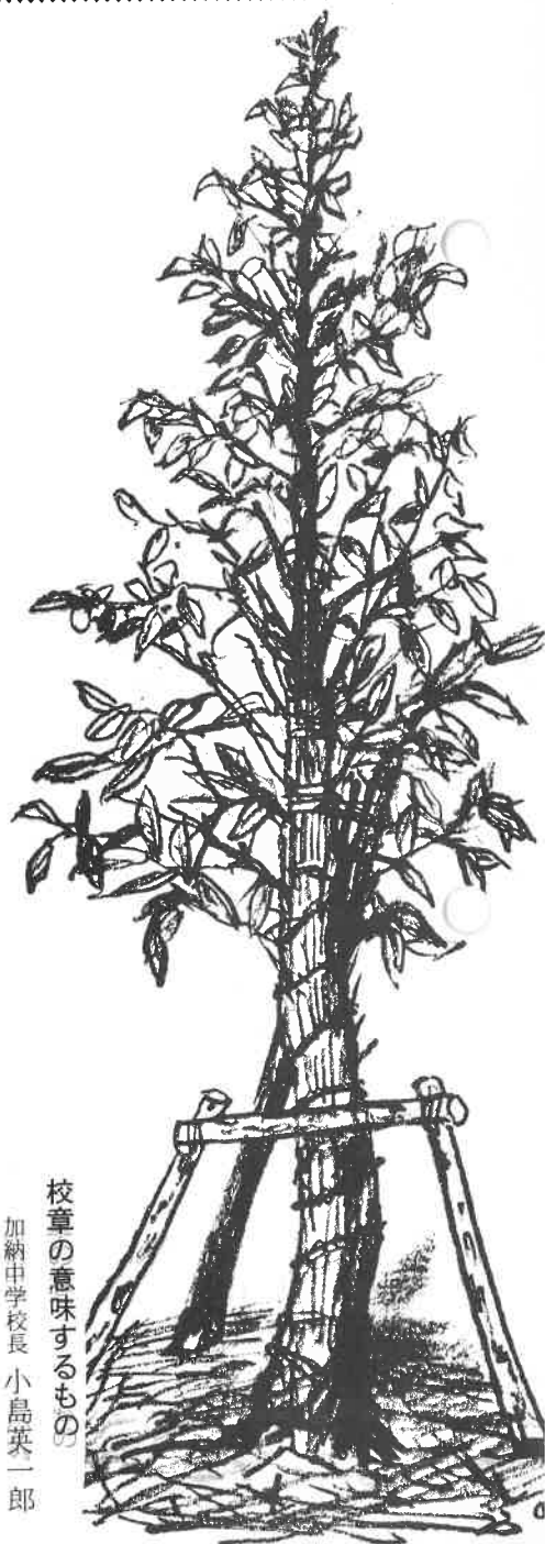
校章の意味するもの